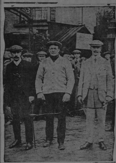
Capitán Fletcher y sus amigos

"Estoy haciendo,—dice—todo esfuerzo para partir pronto y pienso regresar con el tesoro bien asegurado en las bodegas, antes que la inglesa llegue á aquellos mares. Mi buque está ya casi listo en Marsella. Yo seré la única mujer á bordo. Pero toda mi tripulación es de amigos, de gente además bien probada por su osadía y valor, y con todos ellos dividire el tesoro. Tengo datos ciertos con respecto al tesoro. Los adquirí del hijo de un grumete del barco del pirata Bonito. Este hombre,