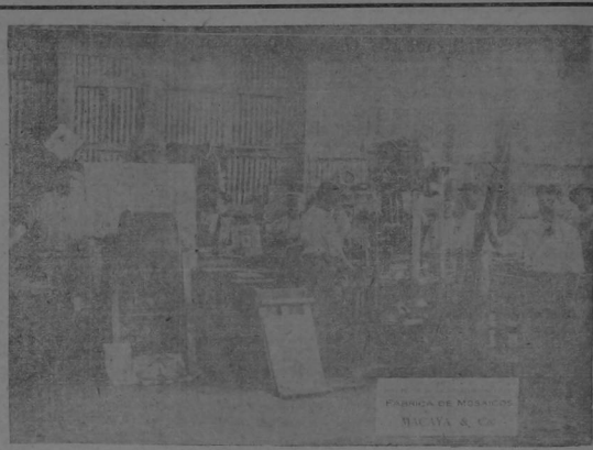
FABRICA DE MOSAICOS HIDRAULICOS