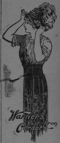
Pradilla y Cia. Agentes para Costa Rica.

Señora: Use Corset Warner Lavables Último Moda Incredibles